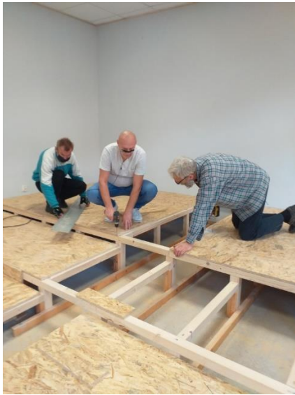
„Wykończenie wnętrz – to watro umieć”